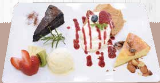
¥1,200 ローソク花火&メッセージなし

しっとり濃厚なくちどけが癖になる美味しさ。チョコレート好きにはたまらない人気商品。