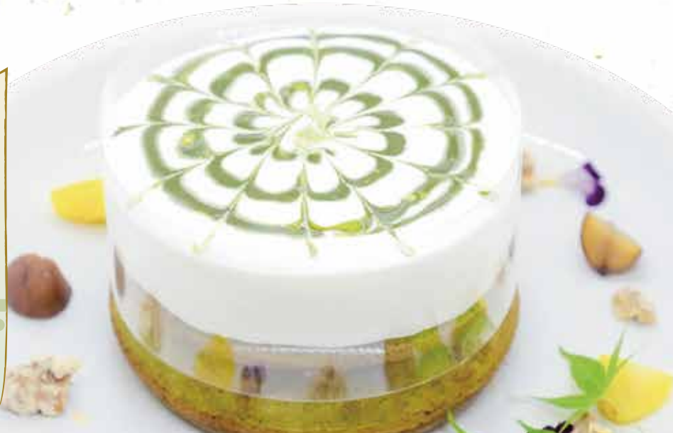
メルティ まっちゃパンケーキ