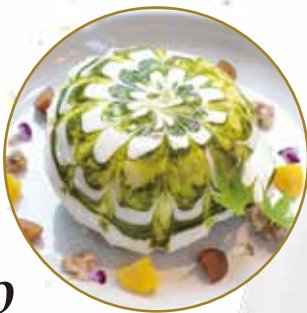
クリームが とろろり

ラム酒を効かせたタルト生地に自家製カスタードと「姫あやか」を使用したさつま芋クリームをたっぷり絞りました。