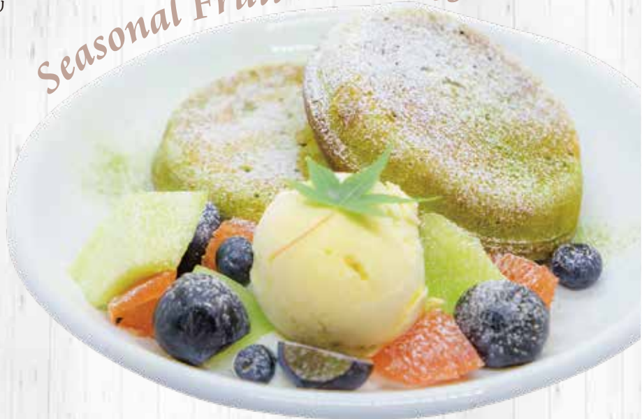
季節のフルーツパンケーキ ~抹茶~ ¥1,100

オーブンで表面をカリッと焼き上げた、当店人気のリコッタチーズパンケーキに、バニラアイスと季節のフルーツをたっぷり盛り付けました。