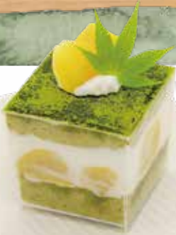
抹茶と栗の ショートケーキ