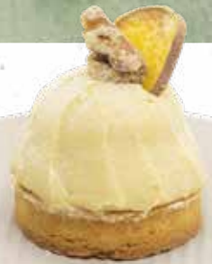
さつま芋の モンブランタルト