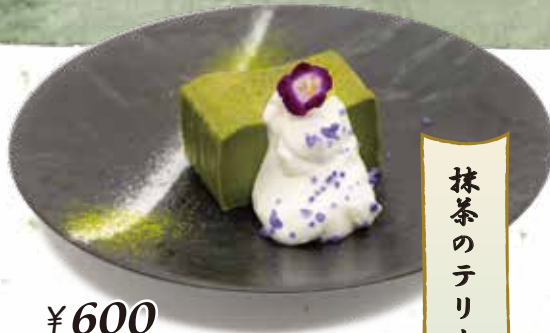
抹茶のテリリーヌ

八女抹茶をたっぷり使った風味豊かなショートケーキ。中には栗の甘露煮がゴロゴロ入ってます！